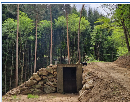
Désableur de Lobrette

Les travaux de mise aux normes des zones de captage sont enfin terminés pour les multiples sources réparties en 4 réseaux bien distincts qui alimentent les hameaux de Saint-Basile.