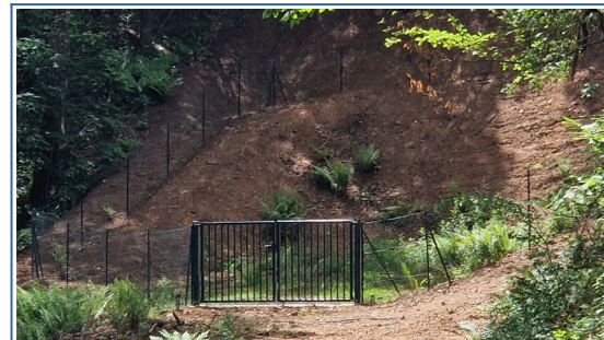
Captage de la source de Lobrette bas